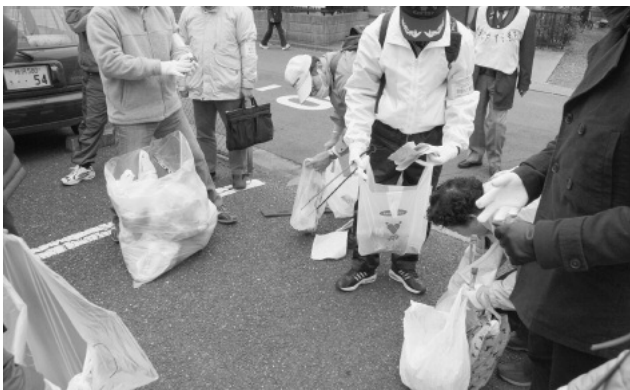
「つながる」ための一手法としての「清掃活動」