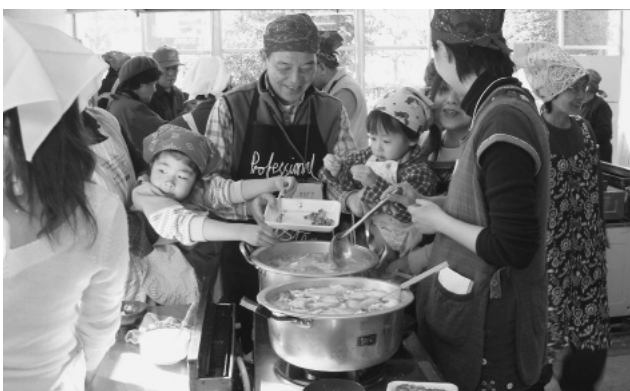
世代間交流イベント「芋煮づくり」の様子。