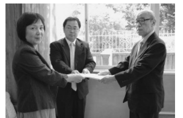
地域福祉活動推進会議正副委員長から、「地域福祉活動計画in所沢」を社協会長に答申

地域福祉コミュニティ推進事業の取り組みを紹介しているブログを開設中! アドレスは: http://communitywork.blog57.fc2.com/