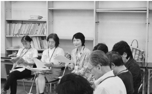
参加者全員でわいわいがやがやと意見を出し合い検討を進めます。