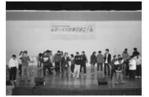
障害児者交流事業の様子