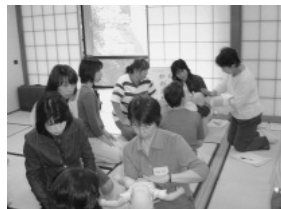
ファミリー・サポート・ センター援助会員講習会