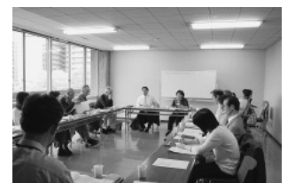
地域福祉活動推進会議