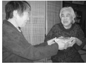
ボランティアがお届けする ふれあい配食サービス