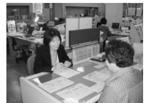
福祉やボランティア等 についての相談窓口