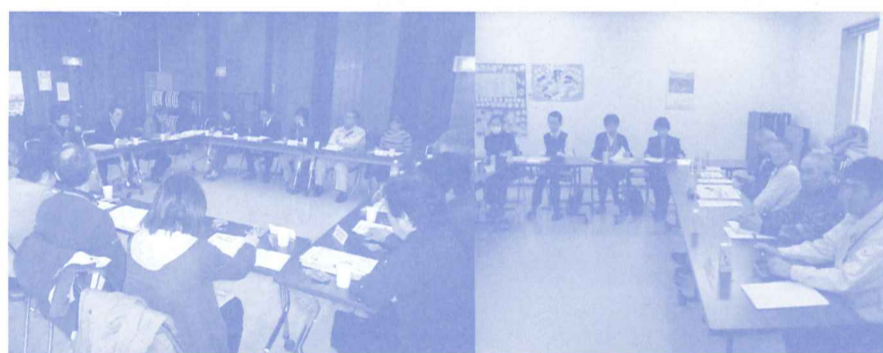
(写真左) 第1回新所沢地区地域福祉ネットワーク会議の様子。 (写真右) 三ヶ島地区地域福祉ネットワーク会議第2回準備会の様子。 地域福祉ネットワーク会議は各地区の地域特性や参加団体の意見を踏まえながら、進め方を検討しています。

平成二十一年度、三ヶ島地区、新所沢地区に所沢社協は地区担当職員を配置し、地域の関係団体に参画していただきながら、地域福祉ネットワーク会議立ち上げに向け、準備を進めました。三ヶ島地区は、平成二十二年立上げに向け、準備会を重ねた他、研修会を開催する予定です。新所沢地区では、地域福祉ネットワーク会議が立ち上がり、二十二年から地区活動計画等の検討に入ります。