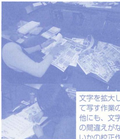
文字を拡大して写す作業の他にも、文字の間違えがないかの校正作業、拡大したものを切り貼りする作業やページを貼り付ける作業等、手が休まることなく作業が続いていました。

「拡大写本所沢はなびら」では、一緒に拡大写本づくりに取り組むボランティアを募集しています。お問合せはボランティアセンターまで。