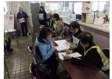
災害ボランティアセンター訓練