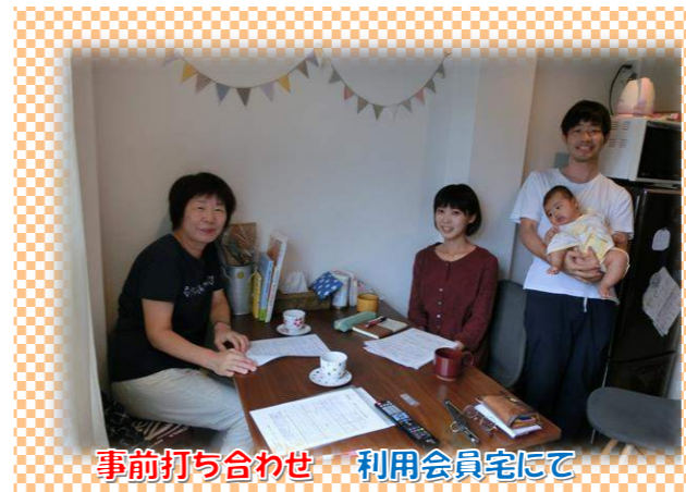
事前打ち合わせ 利用会員宅にて