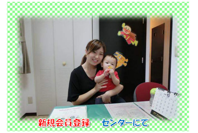
新規会員登録 センターにて