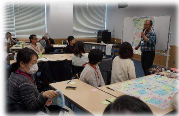
地域福祉サポーター養成講座