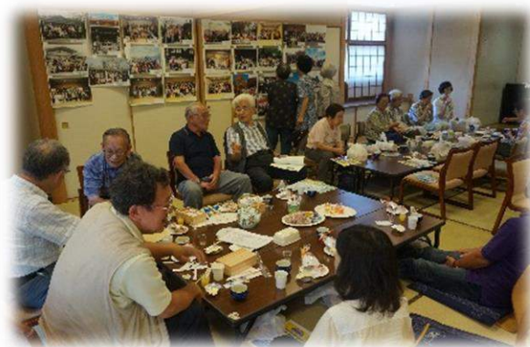
地域でのサロン活動