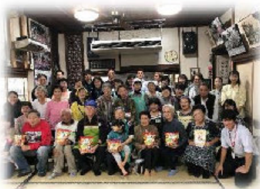
地域でのサロン活動（居場所づくり）

募金運動の推進にあたり、自治会・町内会・区長会の皆さまにご協力をいただいております。