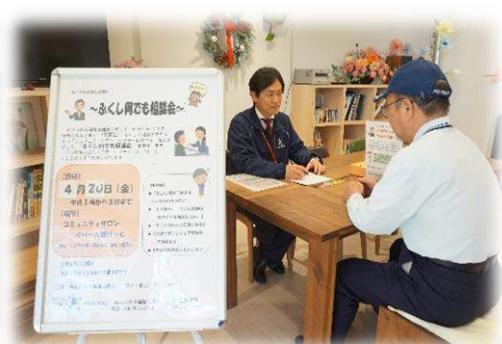
CSW による出張相談会