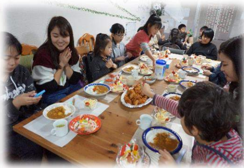
こども支援事業/こども食堂