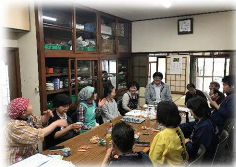
地域でのサロン活動