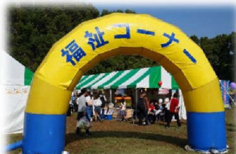
所沢市民フェスティバル「福祉コーナー」