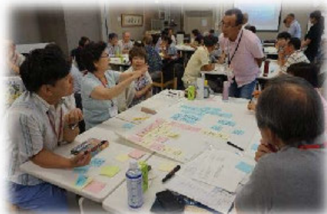
地域福祉サポーター養成講座