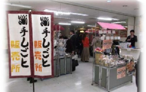
障がい者社会参加促進「手しごと」

募金運動の推進にあたり、自治会・町内会・区長会の皆さまにご協力をいただいております。