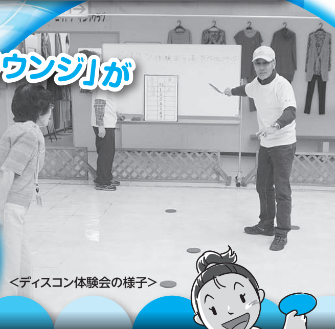
<ディスコン体験会の様子>