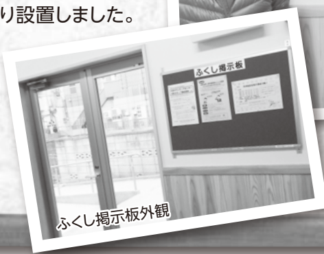
ふくし掲示板外観