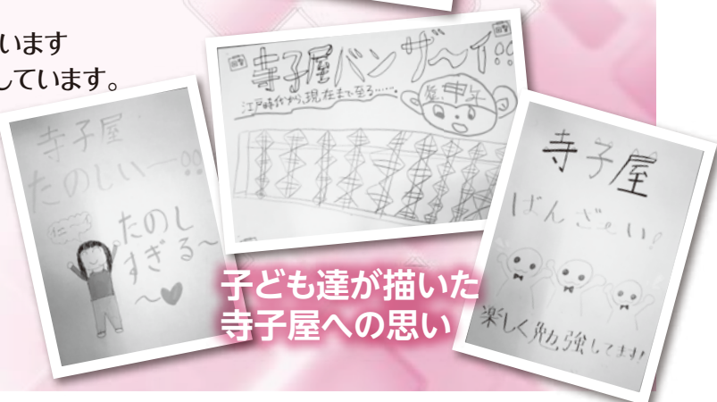
子ども達が描いた寺子屋への思い