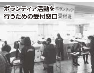
ボランティア活動を行うための受付窓口 受付班

去る1月16日(土)旧庁舎にて、「災害ボランティアセンター運営訓練」を実施し、95名の参加のもと、「ボランティア受付班」「資材班」「被災者役」「災害ボランティア役」などに分かれ、実際の災害時を想定した演習(訓練)を行いました。