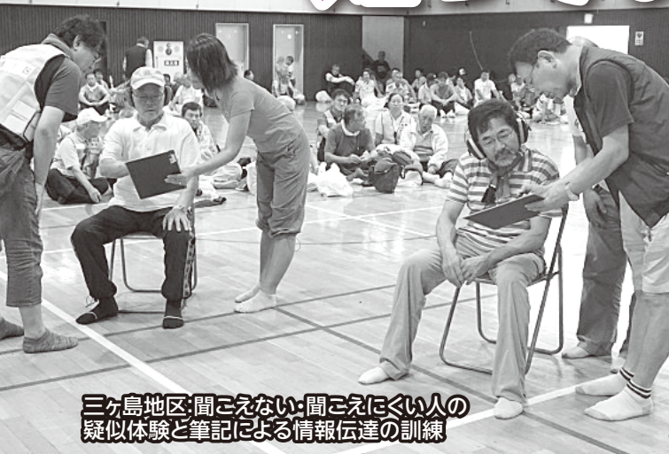
三ヶ島地区:聞こえない・聞こえにくい人の疑似体験と筆記による情報伝達の訓練