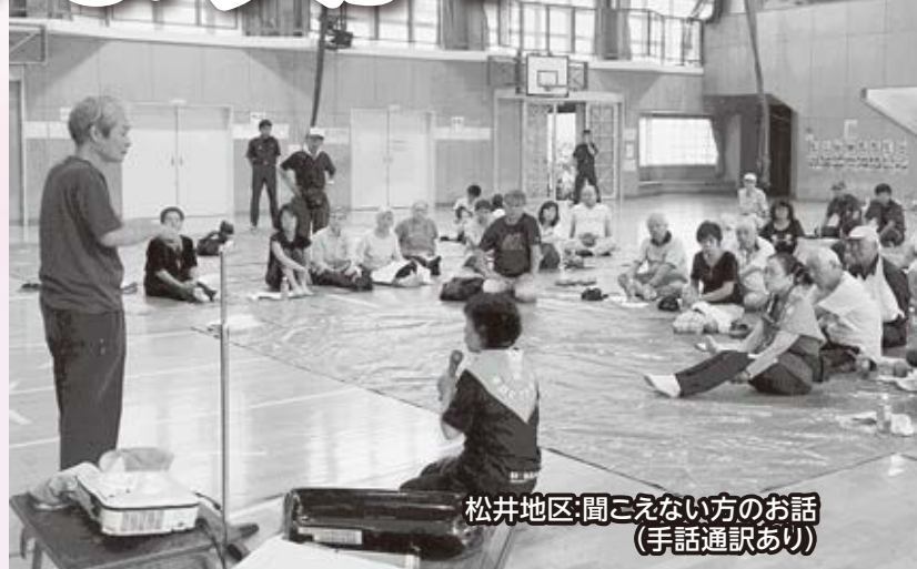
松井地区:聞こえない方のお話(手話通訳あり)

聞こえない・聞こえにくい人は、声や音が届かないため不便な思いをしたり、困ることがあります。その人が聞こえていないことは、ほとんどの場合、外見からはわかりにくく、聞こえない・聞こえにくい人にとって、見えない壁になっていることがあります。特に、地震や台風等の災害時や火事等の緊急時には、大きな不安を抱えるだけでなく、情報が届かないために逃げ遅れたり、避難所で物資を得られないという場合もあります。