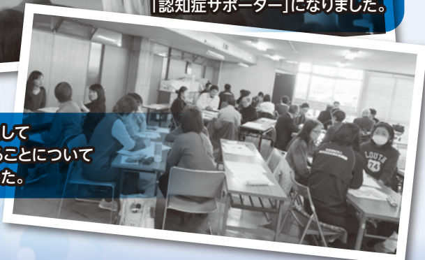
サポーターとして各自ができることについて話し合いました。