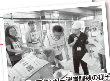
H28年度 災害ボランティアセンター運営訓練の様子

活動の趣旨にご賛同いただき、社協会費にご協力くださいますようお願い申し上げます。