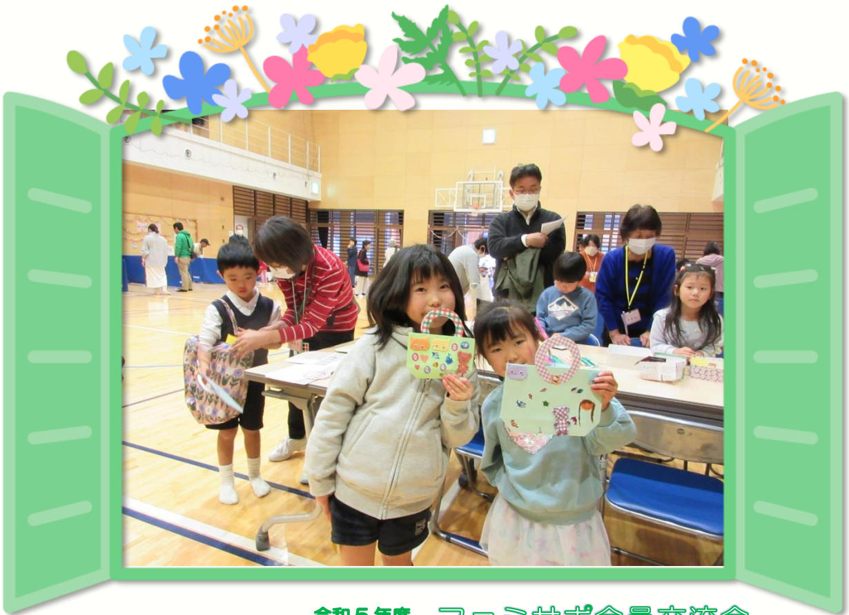
令和5年度 ファミサポ会員交流会